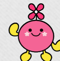
花の妖精 もーりん