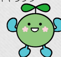
葉っぱの妖精 くーりん